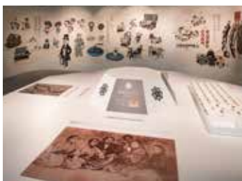
パズルや龍馬の文字での名刺づくりをお楽しみいただけます。