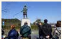
▲昨年のウォーキングイベント