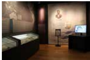
▲ジョン万次郎展示室

○ジョン万次郎展示室 ジョン万次郎の漂流からアメリカでの生活などを聞き取り、記した「漂異紀略」を展示。デジタル画像で各ページも紹介しています。