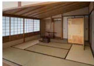
龍馬が暗殺された近江屋の部屋の復元展示座敷で記念撮影もできます。