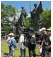
▲昨年の龍馬フォーラム