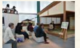
昨年の「龍馬まつりin記念館」▶

多くの方に高知県立坂本龍馬記念館を楽しんでいただける、多彩なイベントを館内各地で開催します。