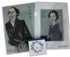
ミュージアムショップでは当館オリジナル商品もお買い求めいただけます。