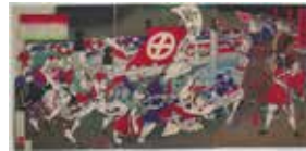
▲錦絵「鹿兒島戦記」(当館所蔵)

○担当学芸員によるギャラリートーク ①10月17日(土) ②12月5日(土) 各14:00～