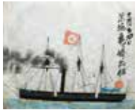
▲いろは丸の図「白帆進進外国船出入進進」より(公財)銅島報効会所蔵・佐賀県立図書館寄託

海運業をめざし、「世界の海援隊」を夢見た龍馬と、万次郎。二人に共通するのは「船」である。船は幕末という時代を大きく前進させた。万次郎と龍馬ゆかりの船に係る事柄を検証し、時代を動かした船について考えていく。