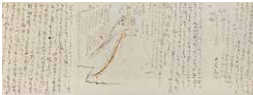
慶応2年12月4日、姉・乙女宛の龍馬書簡、通称「新婚旅行の手紙」(部分)※複製